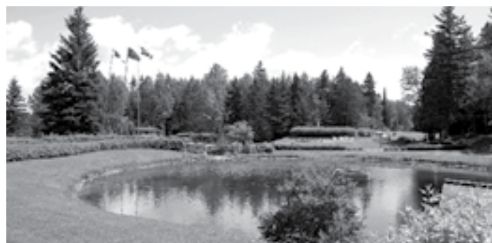
En 2019, les trous #7, 8 et 9 du club de Golf Lac-Saint-Jean seront réaménagés dans le cadre de l'agrandissement du parc national de la Pointe-Taillon.

« C'est important qu'il y ait consensus autour des actions que nous entreprenons pour servir les citoyens dans le meilleur intérêt de la municipalité. La formation d'une équipe de travail efficace nécessite l'établissement d'une bonne chimie. C'est ce qui a été fait en 2018. Je suis très confiant et positif pour 2019, la municipalité est sur la bonne voie de son développement ».